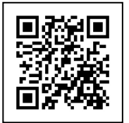
受講料等申込 フォームQR